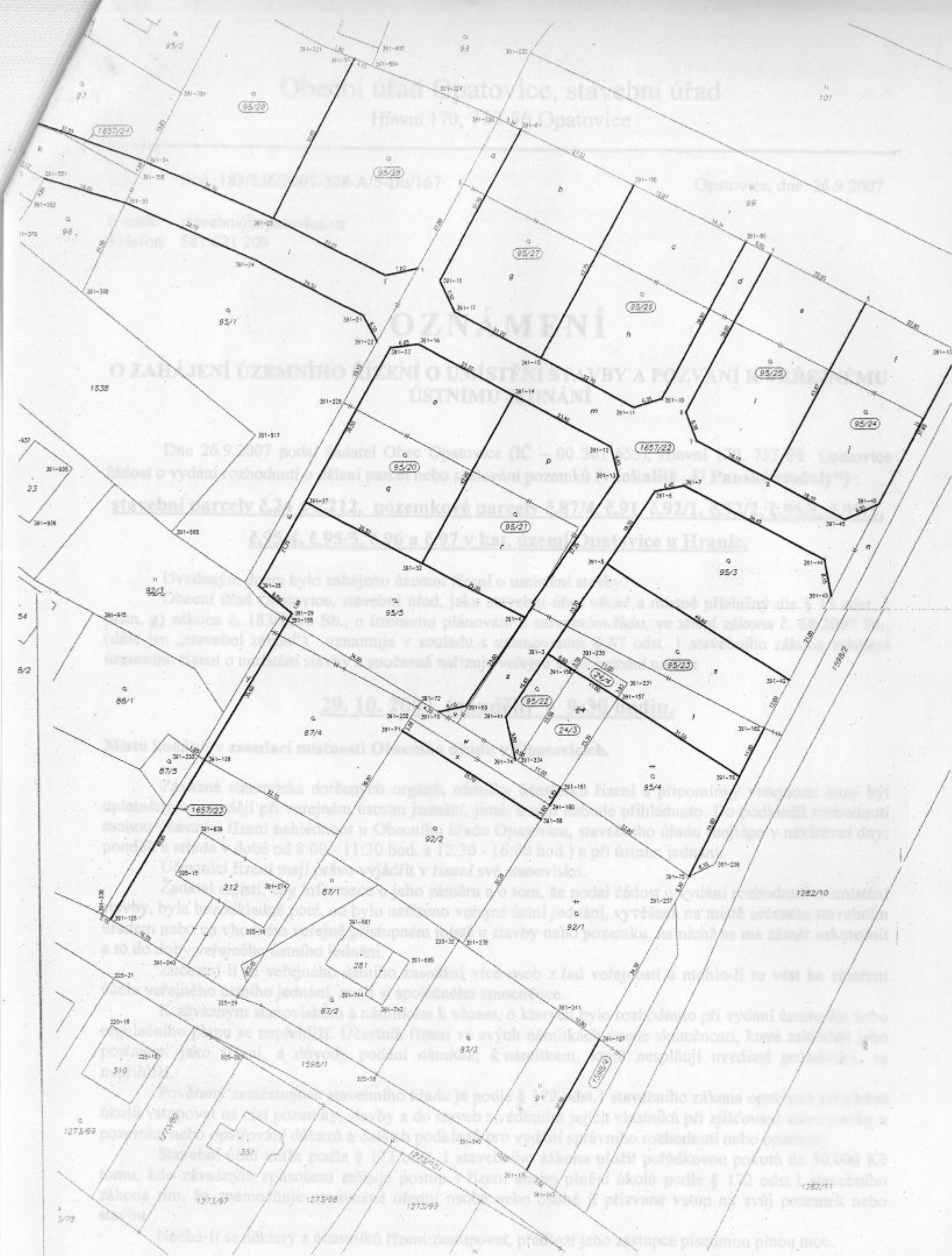
Příloha k č.j: St.ú.:183/836/2007-328-A/5-Bu/167